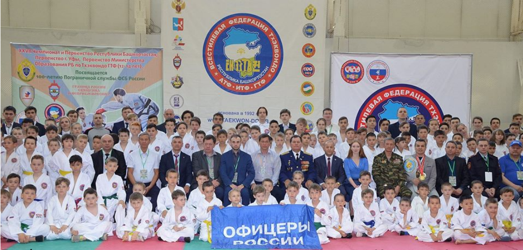
Федерация Тхэквондо Республики Башкортостан